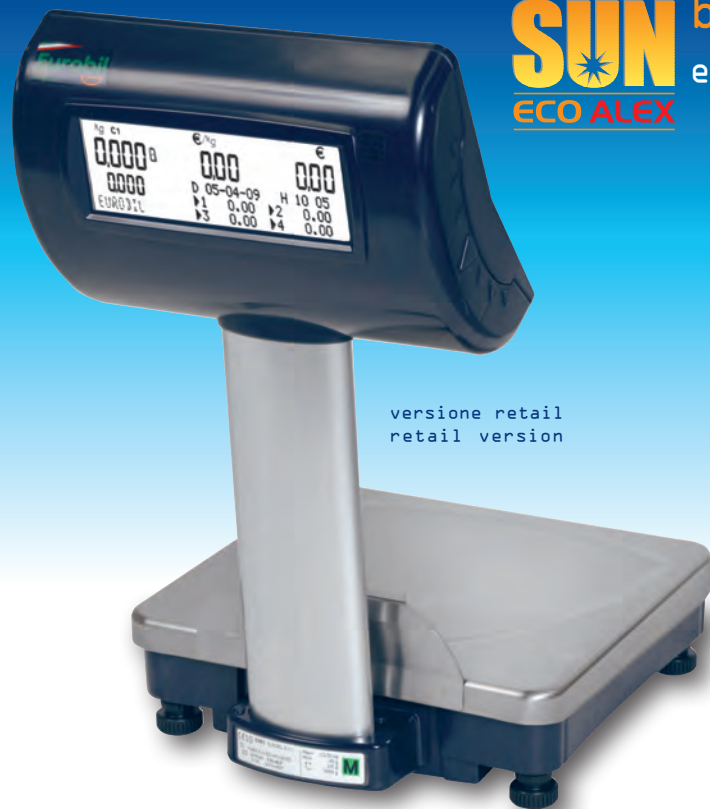
versione retail retail version