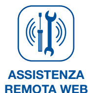
ASSISTENZA REMOTA WEB